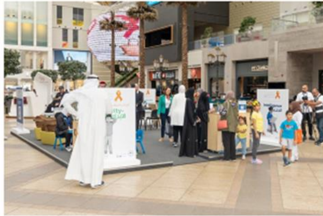
جاناب من ركن كالد لنشر الوعي حول اضطرابات وصعوبة التعلم وتشتت الانتباه في مجمع الأفيوز

وتستمر الحملة حتى نهاية الأسبوع الجاري باستقبال أولياء الأمور والأطفال للإجابة عن استفساراتهم وتقديم الاستشارات المجانية للسعي وراء التشخيص المبكر لهذه الاضطرابات التي لها سلبيات جمة في التحصيل الأكاديمي والحضور المدرسي والاجتماعي إذا تم تجاهلها لاسيما أن ما نسبته 10 إلى 20 في المائة من الطلبة يتم تشخيصهم بها حسب الإحصائيات العالمية.